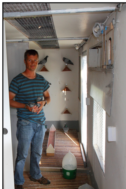
Inne hos flyverne