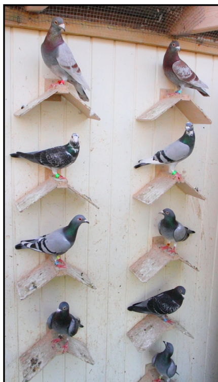
Noen av avlsduene