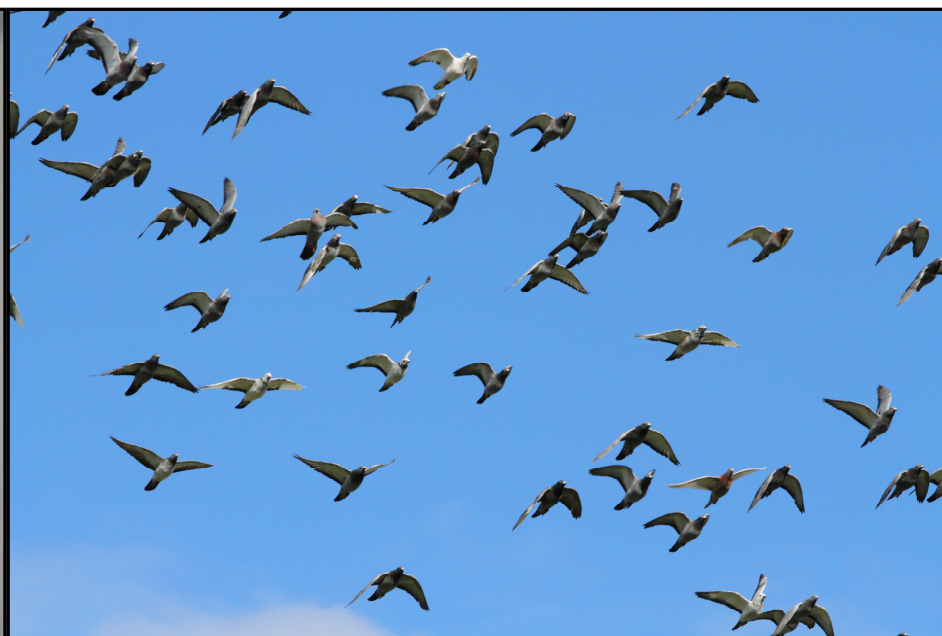
Årets ungduer i fint driv.